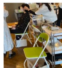
持ち込みのイス 持込みも可能です ※ブース範囲を厳守してください