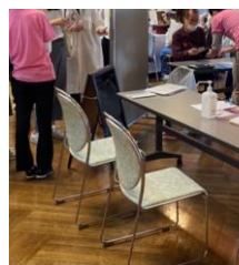
会場に用意あるイス 会場にご使用いただける イスのご用意があります