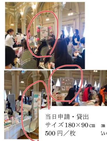
パーテーションのイメージ